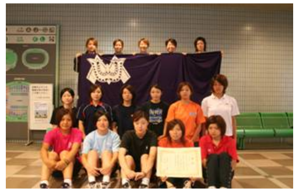
女子団体 3位 龍谷大学