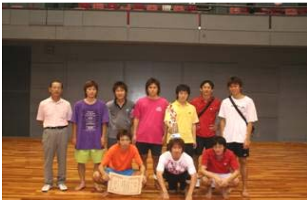
男子団体 準優勝 立命館大学