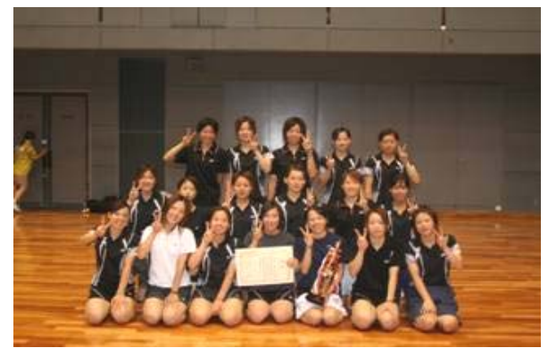
女子団体 準優勝 東海女子大学