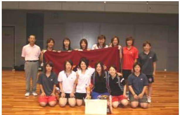
女子団体 優勝 立命館大学