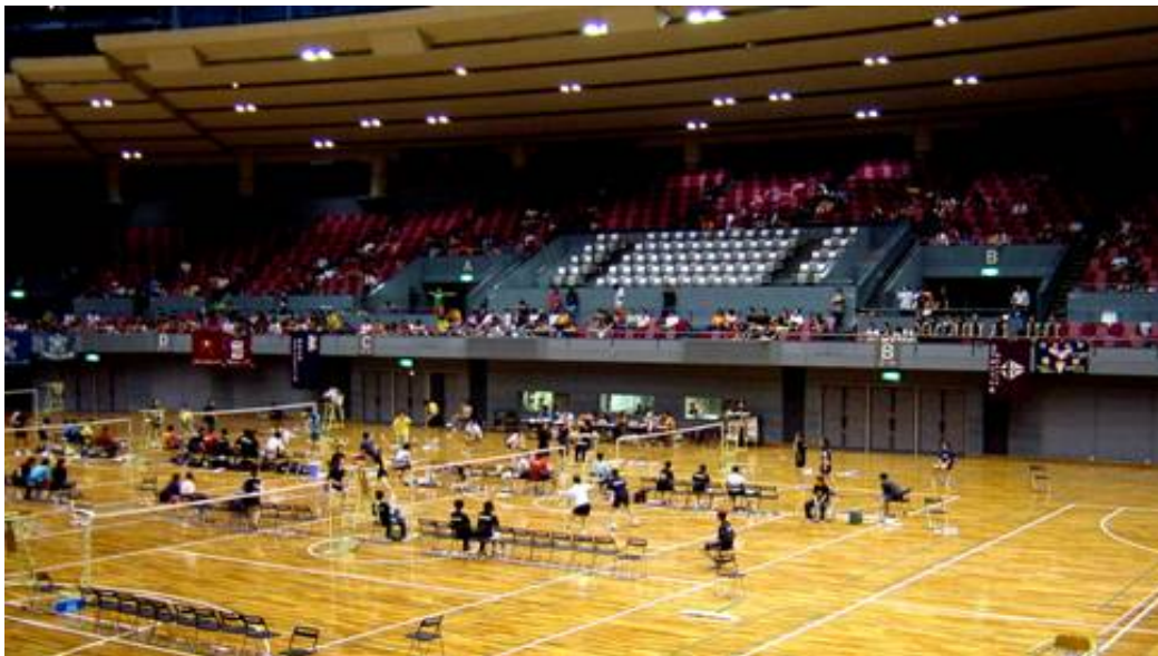
団体戦(平成18年9月5日 広島県立総合体育館(グリーンアリーナ))