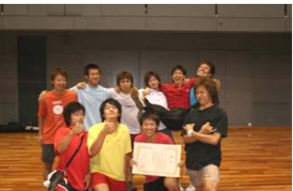
男子団体 3位 九州国際大学