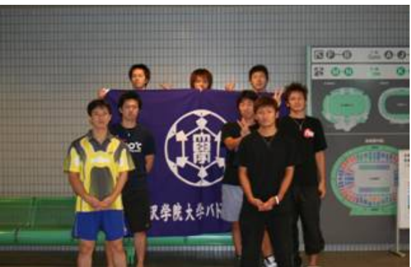
男子団体 3位 金沢学院大学