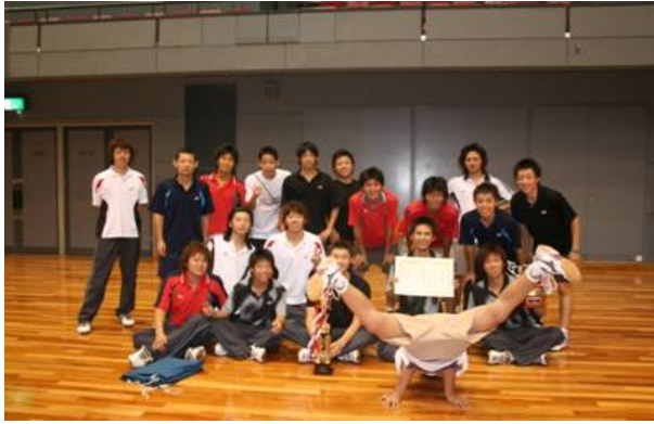
男子団体 優勝 近畿大学